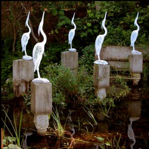
Blaureiher (1994), Höhe: 9.2 m Hokkaido, Japan