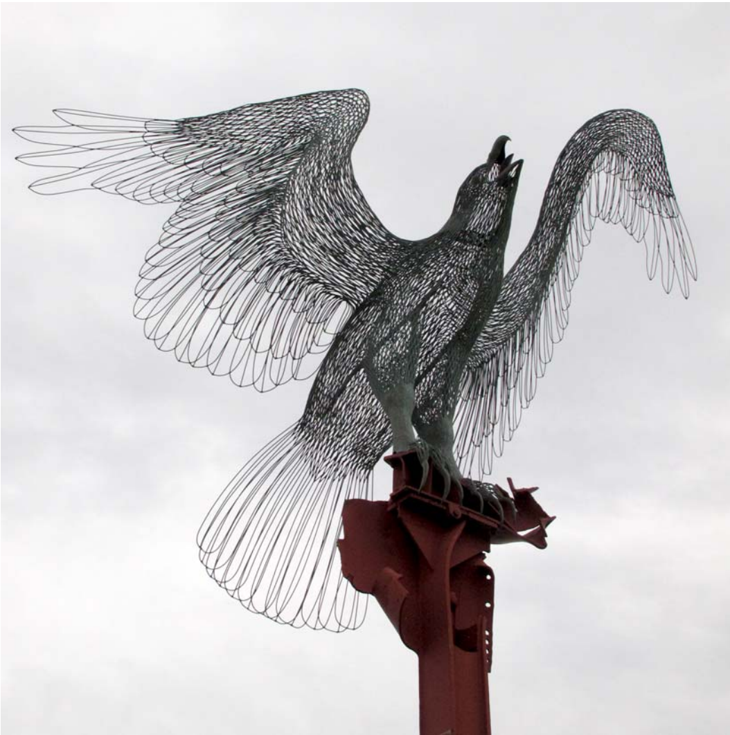
Morning Call (2011), Bronze, Stahlreste vom WTC NYC, Höhe 12.5 m