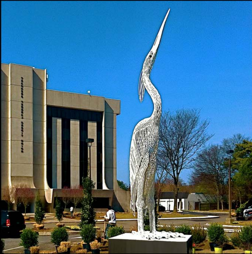
Hope (2012), Höhe: 7.0 m Centerreach, NY, USA