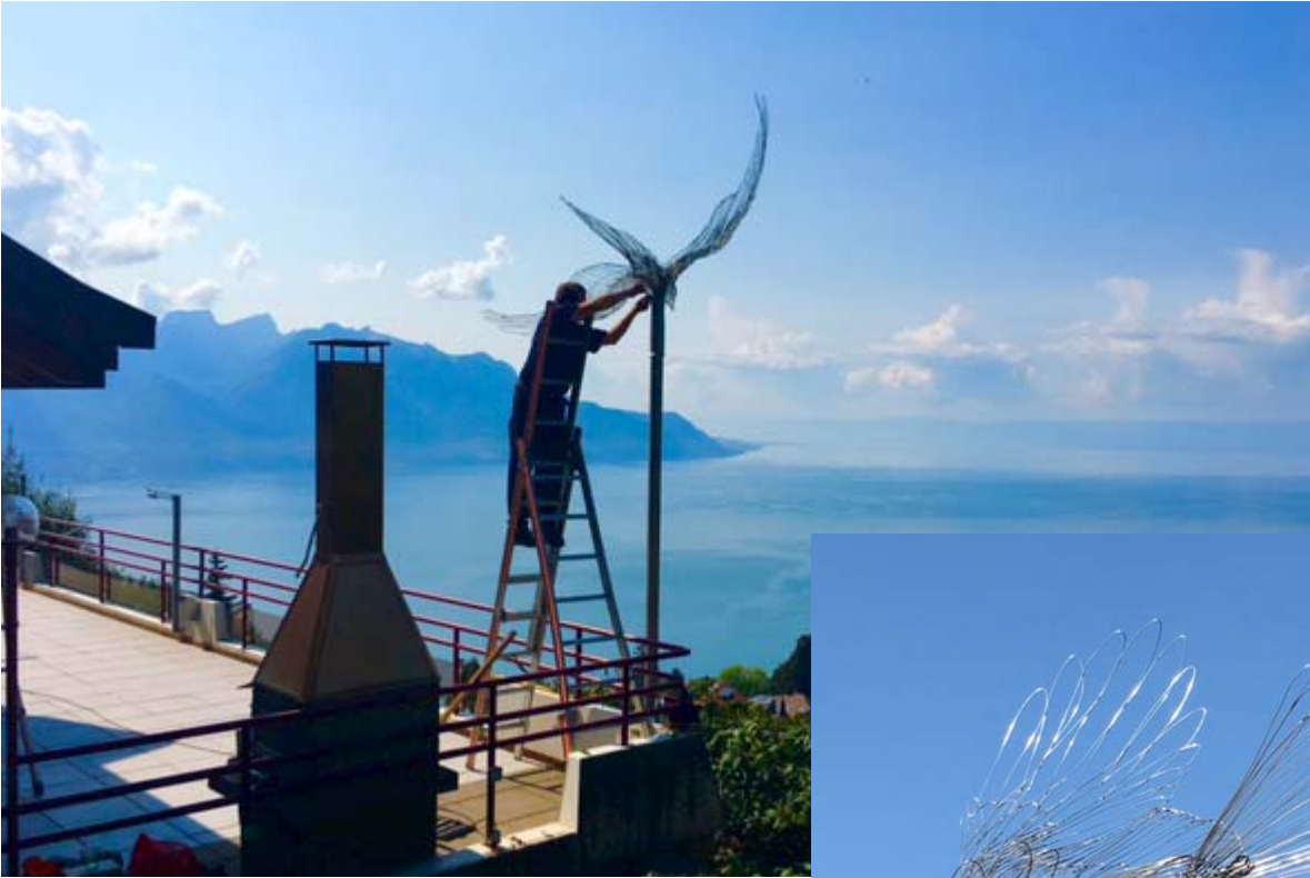
Rotmilan, Glion- Montreux, Schweiz